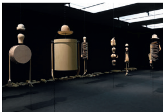
Wiebke Siem, Der Traum der Dinge, 2016/2022, vue de l'exposition au Musée d'art moderne, Salzbourg

L'artiste allemande Wiebke Siem (*1954) fait entrer avec fracas le fantastique grotesque dans le quotidien domestique. Que ce soient des déguisements, qui invitent à se glisser dans un autre sexe, ou des meubles avec des bras qui pendillent, Wiebke Siem crée un univers tant comique qu'abyssal, qui démasque, avec ironie et finesse, les contradictions et imperfections de notre cadre de vie. Dans ses œuvres, l'artiste allie un regard féministe à la critique des stratégies problématiques d'appropriation de l'art extra-européen dans le modernisme. Les sculptures ouvrent la voie à de nombreuses associations avec l'histoire de l'art, qu'il s'agisse des figures de Sophie Taeuber-Arp, de l'atelier de théâtre du Bauhaus, de caricatures ou de collages surréalistes.